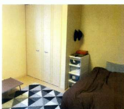
僧坊室内 (Wi-Fi 完備)